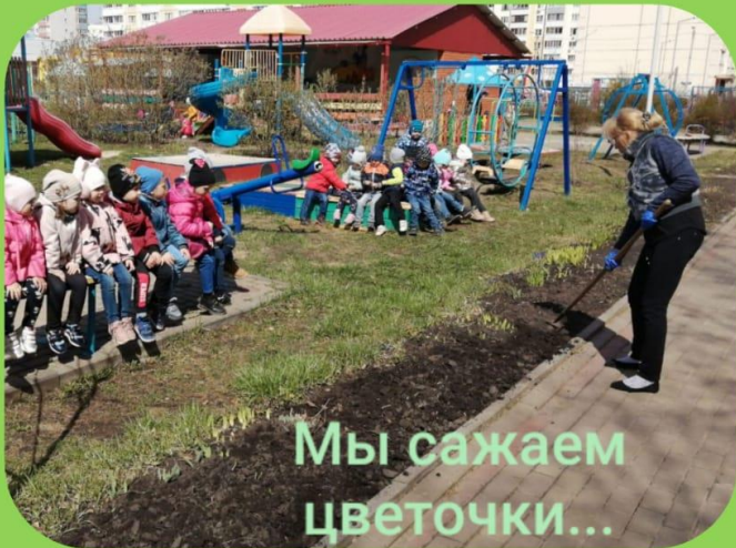
Мы сажаем цветочки...